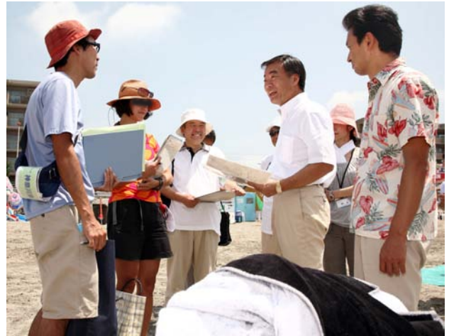
調査に松沢知事が視察に来ました！